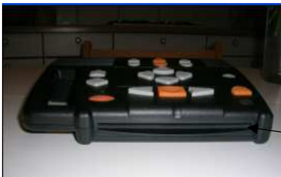
Le dispositif d'introduction du cd (genre mange-disque)

Il suffit d'insérer le CD dans la fente (partie imprimée vers le haut)